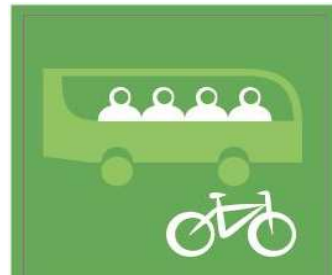
Busco desplazamientos alternativos