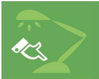
Apago la luz