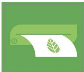
Imprimo de forma responsable