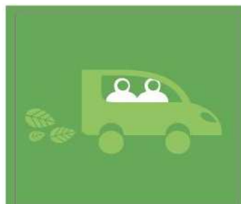
Adopto una Ecoconducción