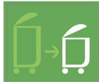
Reduzco los residuos