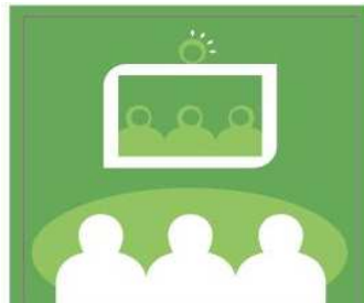
Reduzco mis desplazamientos