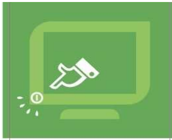
Apago los equipos de oficinas